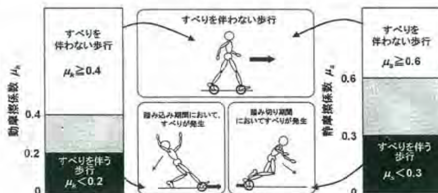
鞋底と床面の摩擦係数と歩行形態の関係

当協会では、この静摩擦係数による測定方法を基本として、タイル等の湿潤状態での静摩擦係数値( \mu_s )が Vit 工法による防滑工事により、未施工のもの比べ 150%～400% 増強するように設