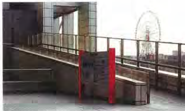
(屋外のスロープ状の歩道)